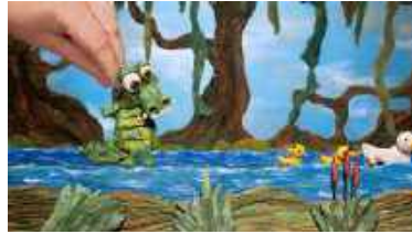
El cocodril no em fa por (2018)