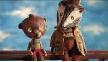
L'extraordinària història de la Bruna (2021)

I+G Stop Motion és una productora independent especialitzada en la tècnica de l'animació stop motion i els ninots animats. Amb aquestes projeccions pretenem recuperar i recordar les nits d'estiu a la fresca que es feia fa unes dècades a Borredà. Els curts que es projectaran seran: