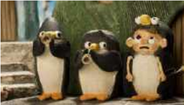
Grand Prix (2011)