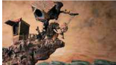
El nen i l'erició (2016)