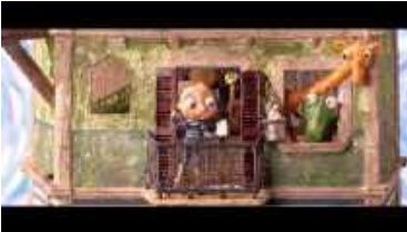
Bloquejats apilats (2014)