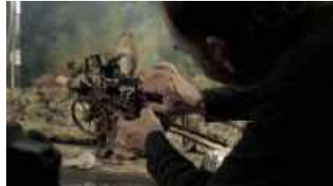
Cavalls morts (2016)